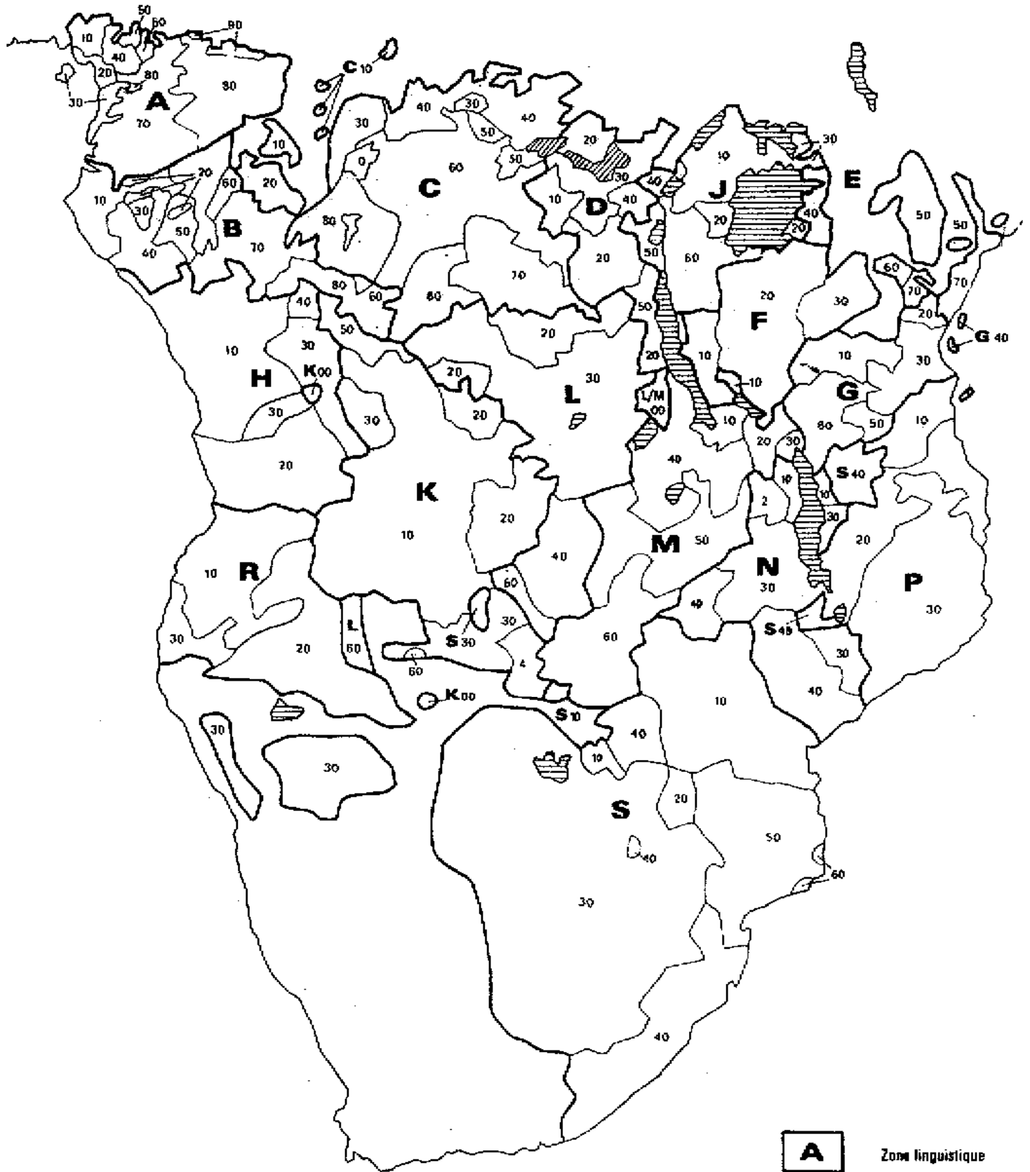
Carte « de Tervuren ».

A Zone linguistique 10 Groupe linguistique